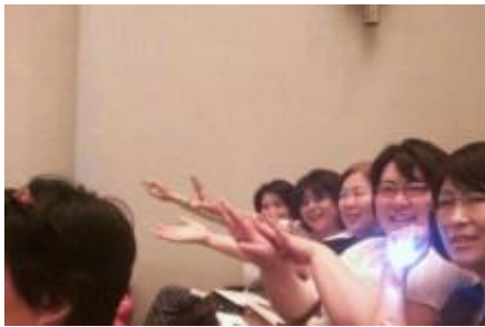
協会員さま・協会スタッフ